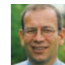
Hannes Germann Ständerat und Präsident Schweizerischer Gemeindeverband